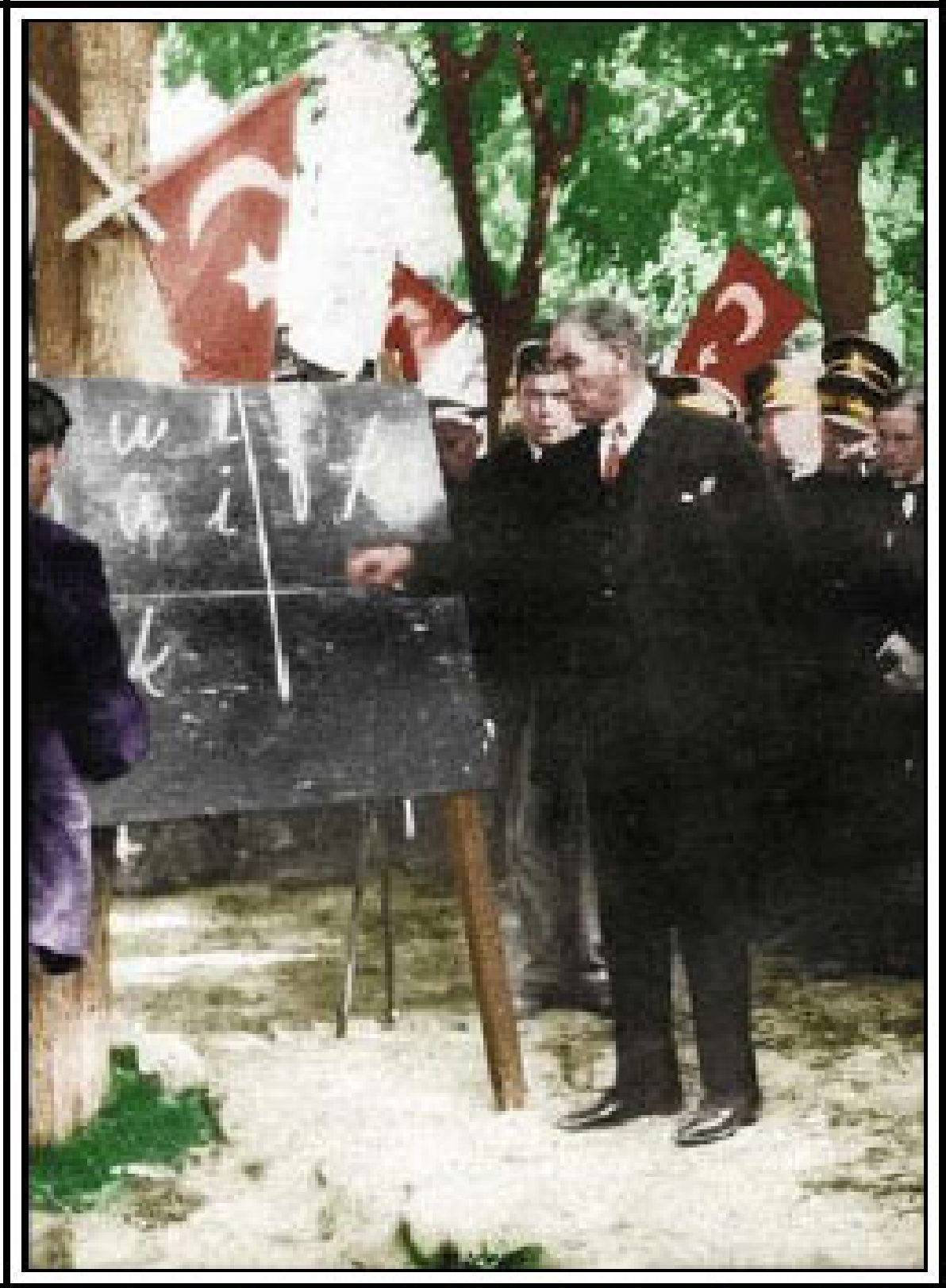
Cumhurbaşkanı Gazi Mustafa Kemal, yeni Türk harflerini halka bizzat öğretirken (20 Eylül 1928)